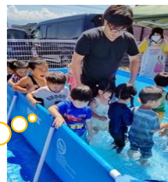
皆が大好き水遊びだよ～