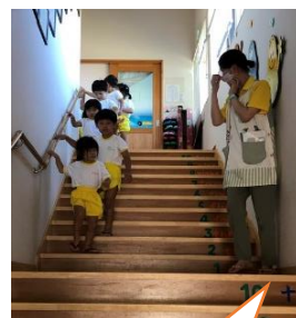
避難訓練 冷静だったわ！

予告 (現時点での予定です) ※9/7,8,9日 祖父母参観 ※ひまわり組 9/18(日)わっしょい黒部 ※10/1(土) 親子運動会 ※10/29(土) 清掃活動