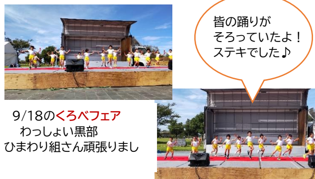
9/18のくろベフェア わっしょい黒部 ひまわり組さん頑張りました